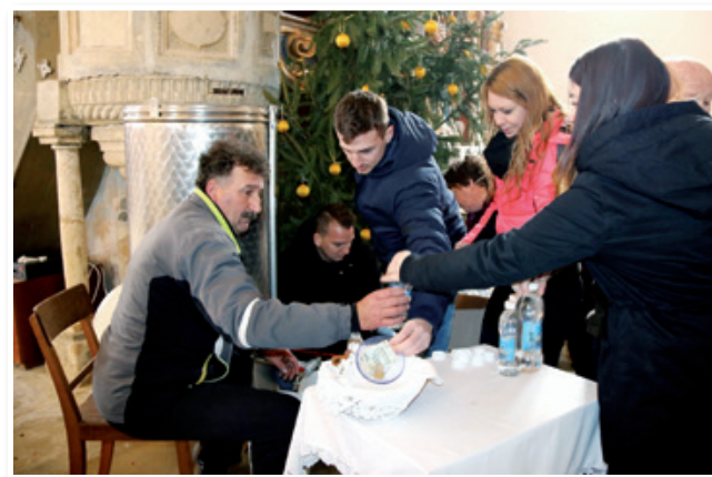
Delitev blagoslovljene trikranjevke vode