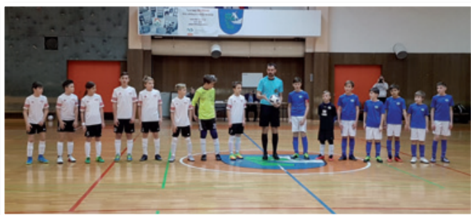
Ekipi igralcev KMN Slovenske gorice in Sv. Trojica v državnem prvenstvu do 13 let

Lestvica državnega prvenstva do 13 let (vzhod) po 9. krogu: 1. KMN Meteorplast (45), 2. FutureNet Maribor (29), 3. FC Litija